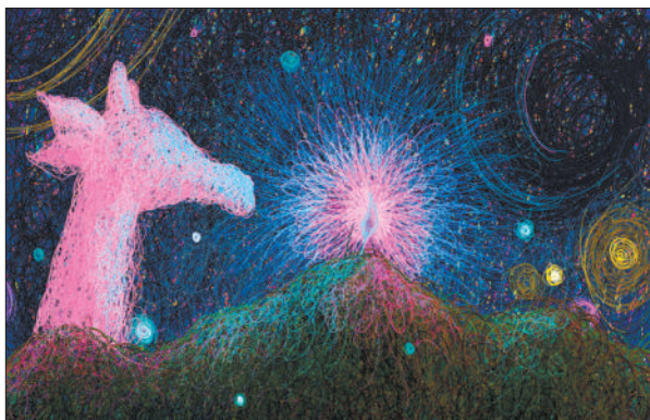
“FEI童鞋”在微博中称,自己的多幅作品(本组图片下图),被盗用于湖南卫视跨年演唱会(本组图片上图)舞台背景画面。微博截图