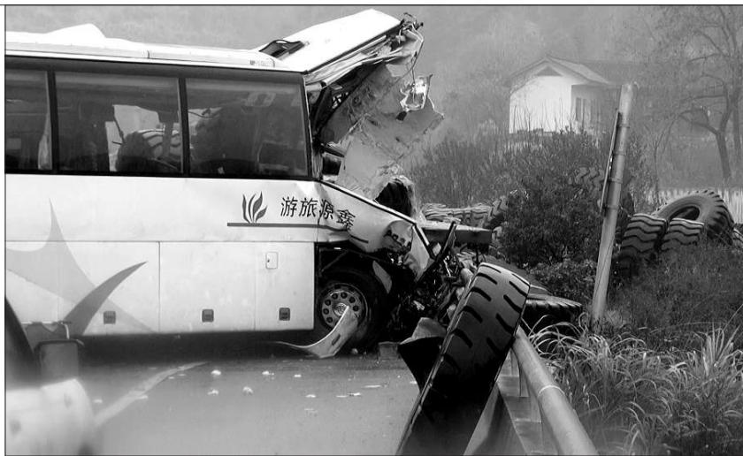
沪昆高速湖南段车祸13人遇难,图为事故现场(视频截图)。