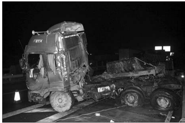
图为昨晚事故现场。重型挂车被撞变形。