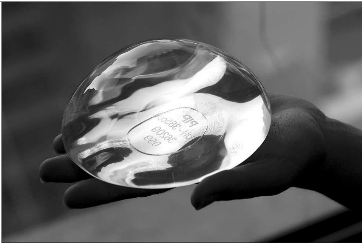
写有法国聚植入修复体公司(PIP)水印的隆胸硅胶填充物。