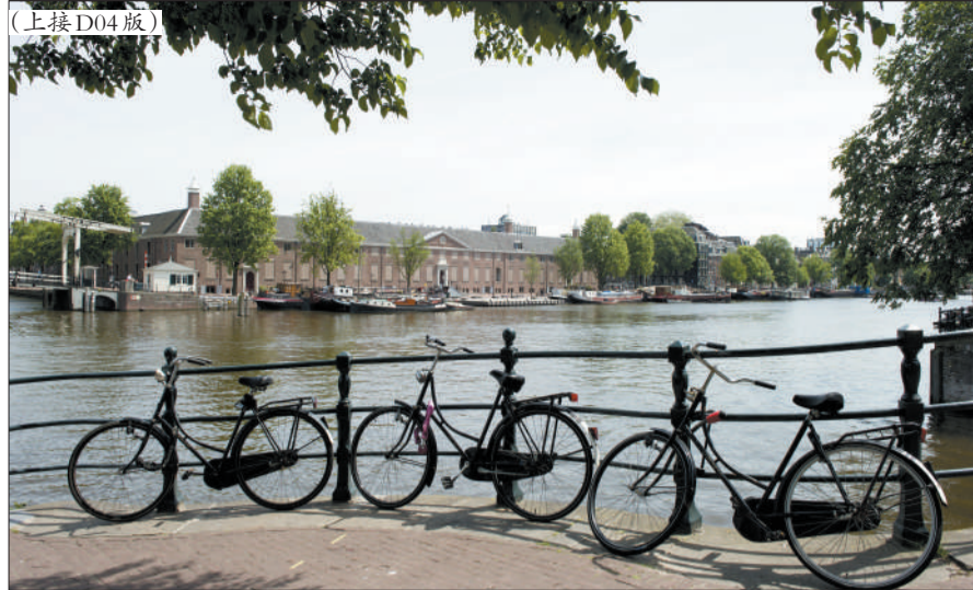
阿姆斯特丹有70万居民,他们拥有60多万辆自行车,此外还有数千辆可供租借。