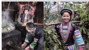
瑶族人采摘草药、熬制药浴