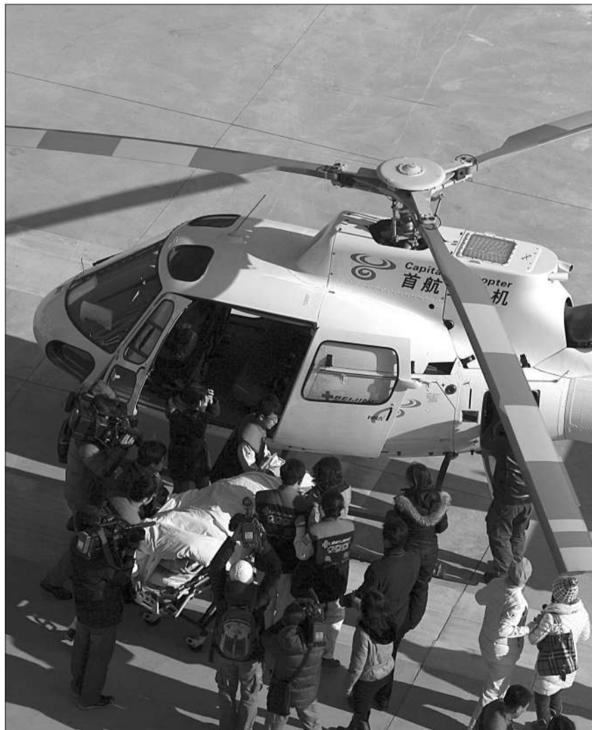
1月3日,直升机降落在999急救中心的停机坪上,一名在滑雪场受伤的外籍男童被直升机从河北张家口接运到北京接受急救。