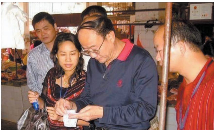
网友发布段一中在市场肉档等地工作视察的照片。