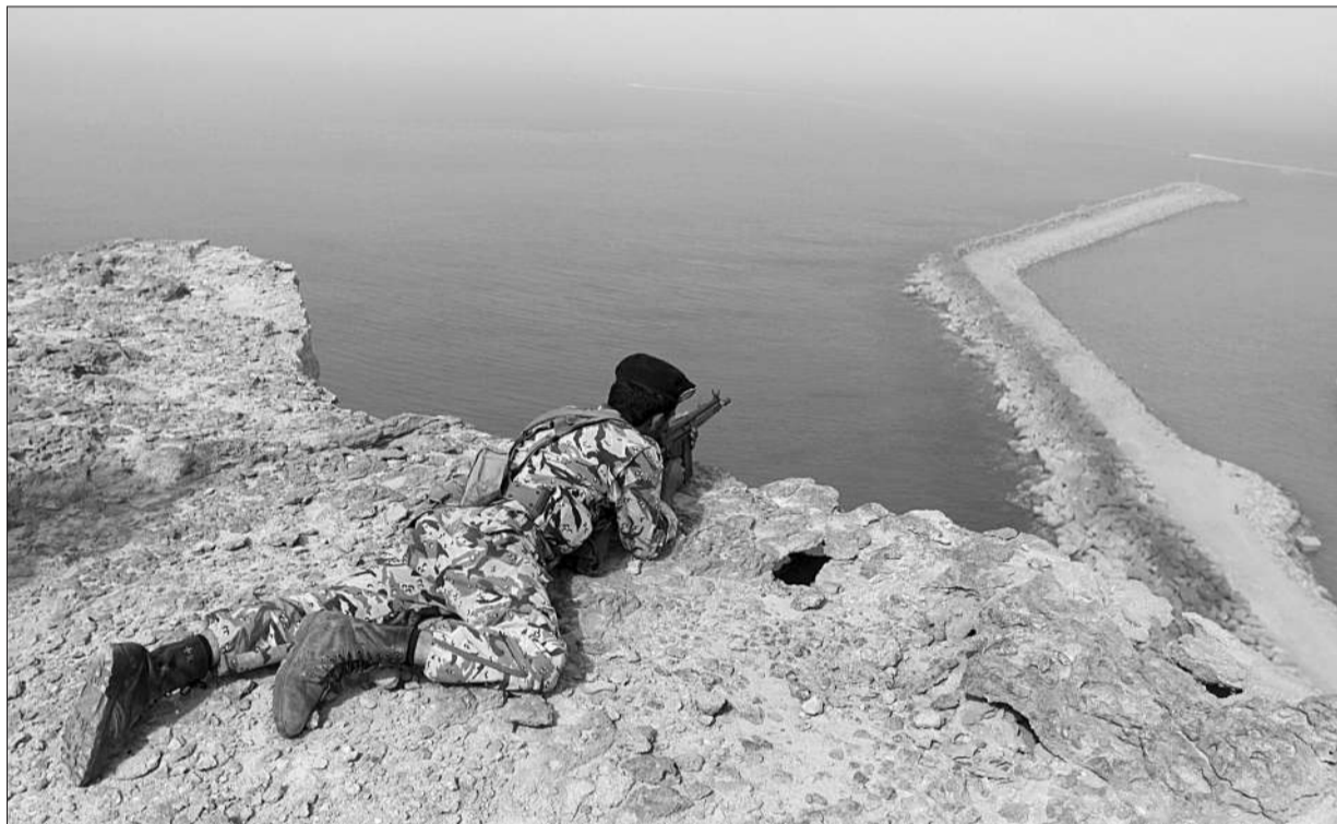
去年 12 月 30 日,一名伊朗士兵在一次演习中。伊朗上周威胁,如西方对伊朗石油出口实施制裁,伊朗将封锁霍尔木兹海峡。