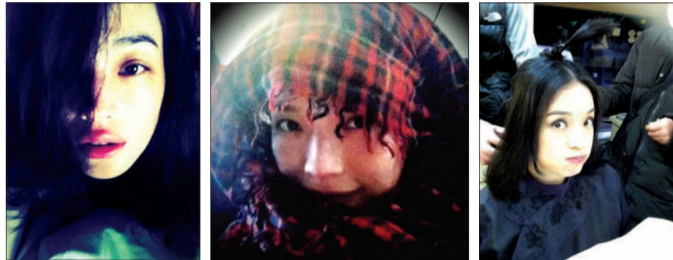
“性感女神”舒淇在微博里是个“卖萌女神”。