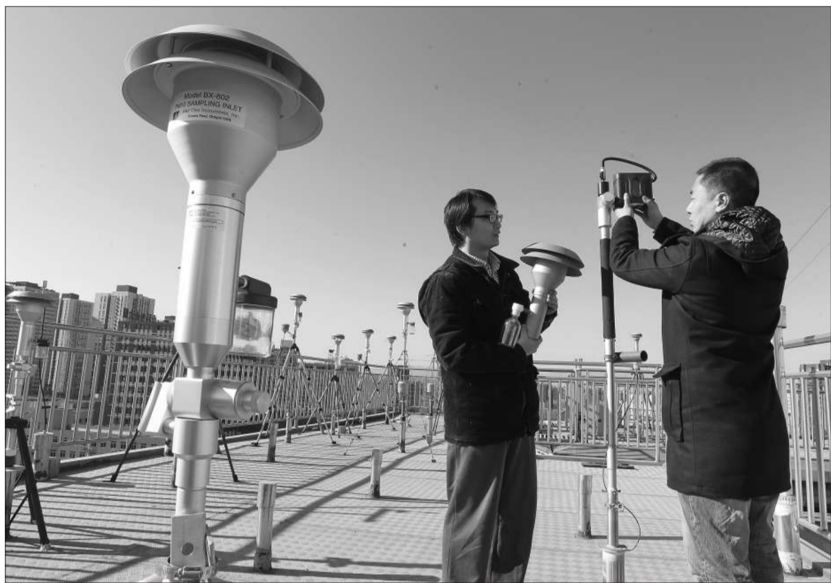
1月4日,北京,中国环境监测总站大气室的工作人员正在对细粒子PM2.5连续检测仪的切割头进行校验。

注:上月底,上海市公布了2006年至2010年PM2.5研究性数据,年均浓度值在44-53微克/立方米之间。