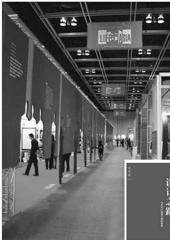
香港设计中心举办的“设计营商周”汇集了世界顶尖设计师,成为世界瞩目的设计盛事。