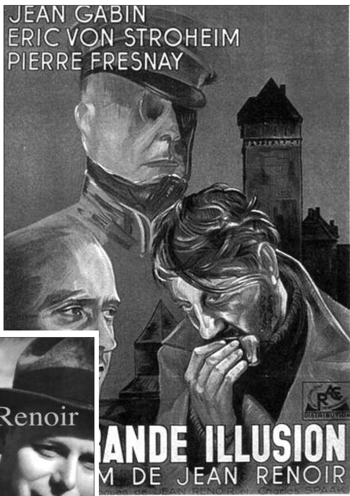
让·雷诺阿的经典作品《大幻影》海报。