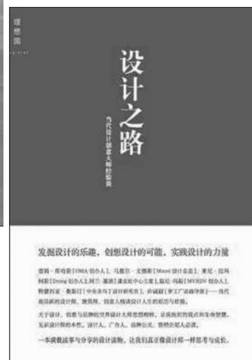
《设计之路》香港设计中心 编 广西师范大学出版社 2011年12月 定价:66.00元