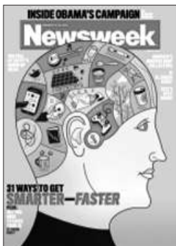
美国《新闻周刊》越变越聪明

英国仍是世界资本之都,但荣耀不在。诸如“占领华尔街”、“占领伦敦”以及针对银行家的“占领任何一个城市”的攻击行为,在去年无异于令人沮丧的经济新闻“添油加醋”。按诸多标准衡量,伦敦仍是世界最大的金融中心,唱衰它对任何人都无益。