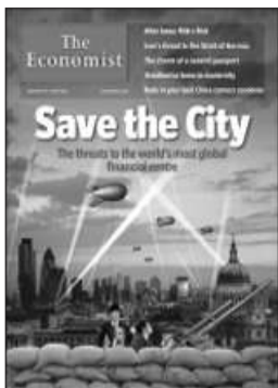
英国《经济学人》救救伦敦吧

罗姆尼赢得共和党预选首战。之所以成为党内“领头羊”,取决于其筹款能力和强大的人脉资源。当然,其他党内候选人也还有戏,罗姆尼的前路也很崎岖。赢得首战后,罗姆尼发表演讲一如往常般充满政治激情。而他的对手、前参议员桑托勒姆的演讲则有个人特色。