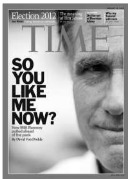
美国《时代》喜欢我吗?

尽管面对燃料价格猛涨、养老金改革以及外国对印度直接投资停滞不前等难题,然而印度执政联盟“UPA”最怕的难题是如何应对西孟加拉邦首席部长马塔·班纳吉女士的挑战。她不是Lady Gaga,而是足以成为政治变革催化剂的Lady Dada。