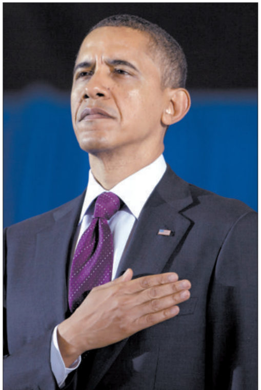
美国现任总统奥巴马。