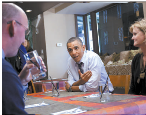
奥巴马与支持者在华盛顿共进晚餐。

2011年4月4日,美国总统奥巴马竞选团队启动竞选网站,正式宣布参加2012年总统大选。这一次他们仍将竞选大本营设在芝加哥市,这是美国历史上总统首次将连任竞选总部设在华盛顿以外。对此,奥巴马表示,他不希望自己的竞选仅仅只听到来自学者和权力代言人的声音,站在这里的支持者才是让他开启白宫之路的人。通过网络与选民互动是奥巴马2008年竞选一大特色,这种方式也创造了奥巴马奇迹。竞选团队主管梅西纳表示,团队未来将在互联网上做出更多努力,这些努力将让2008年的网络宣传显得“过时”。如今他们能否继续为他铺设一条连任之路呢?