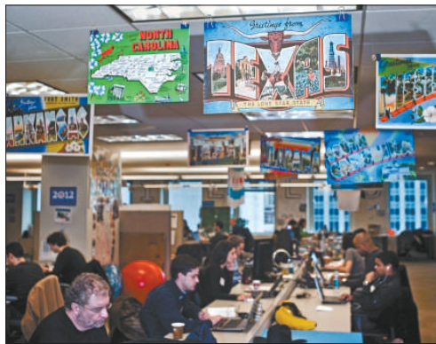
位于芝加哥的奥巴马竞选总部室内布置非常活泼。