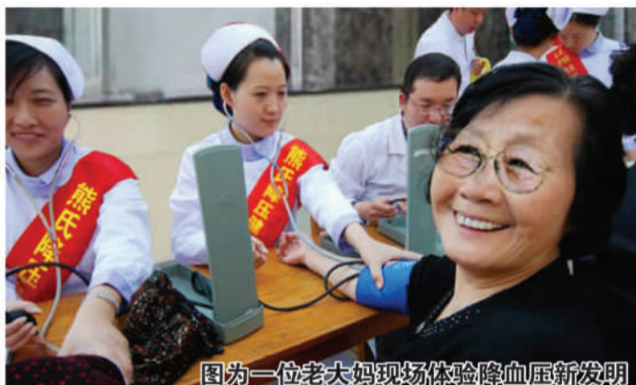
图为一位老大妈现场体验降血压新发明

几分钟后,外国友人纷纷惊呼“心里舒坦,头晕消失”。半小时后测量血压,发现血压降低数多个值。中