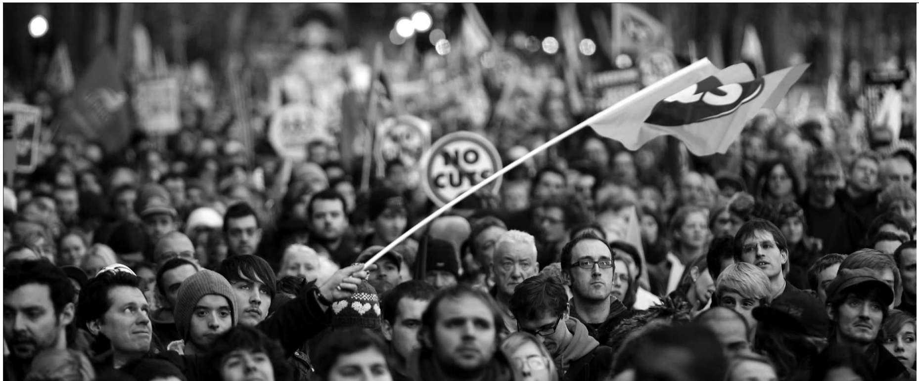
2011年11月30日,英国伦敦爆发数十年来最大规模的公务员罢工。英国工会表示,因不满政府削减养老金计划,最多200万公共部门员工参加了罢工。