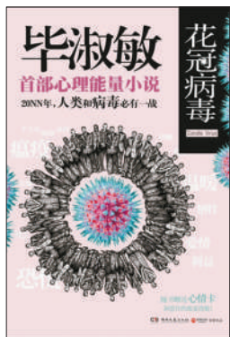
毕淑敏转型写起了科幻小说。

“两岸隔绝已久,阻断了亲情也阻断了文化沟通,而这本小说则试图还原历史的气息,如同带我们到对岸寻找亲人。”