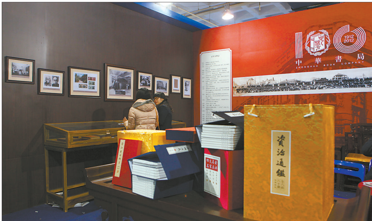
因为2012年是中华书局百年庆,展览现场被布置得喜庆而古雅。

相对于原创文学的冷清,外国文学出版显示出多元化,花城出版社推出了以匈牙利作家卡达莱为主的一套东欧作家丛书,重庆大学出版社推出了瑞士文学大师的作品。