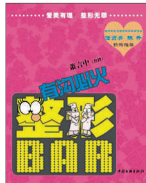
《整形BAR》(全4本) 作者:萧言中 中国文联出版社 2011年12月 定价:112.00元