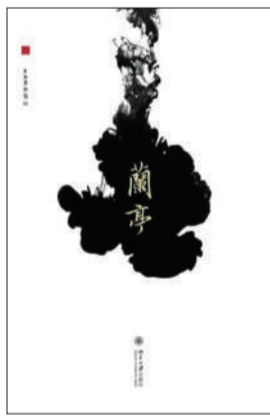
《兰亭》 上海博物馆编 北京大学出版社 2011年9月 定价:58.00元