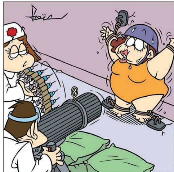
鉴于您必须注射“消脂针”的剂量考量,大夫决定用比较“快速”的方式……