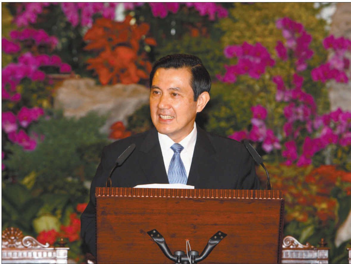
2008年11月6日,马英九在台北宾馆会见海协会会长陈云林一行。这是马英九致辞。

贴上“无能”标签,声望大幅下滑,国民党在多场局部性选举中接连受挫。同时,马英九推动国民党改革转型,引起党内严重不适和多方反弹,削弱了选举动员能力。这都是马英九此次陷入苦战的主因。