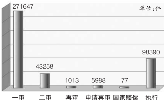
2011年各类案件审判程序结案情况示意图 单位:件