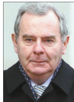
爱尔兰前首富奎因。

2008年爱尔兰债务危机爆发前,《福布斯》杂志将奎因的净资产估计为大约60亿美元,列爱尔兰个人财富榜第一名。但是奎因一家在该国债务危机前夕,用自有资金和大量借款购买了英爱银行28%的股份。该银行在爱尔兰房地产市场泡沫破裂时股价大跌,后来被收归国有,奎因也因此欠下巨债。据奎因去年11月的材料,他目前拥有3个银行账户,里面只有不到11000欧元的现款。(黄锐)