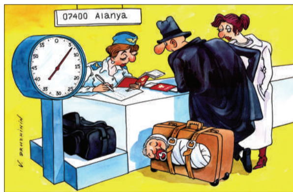
带上老婆孩子,回家 瓦伦丁(俄罗斯)