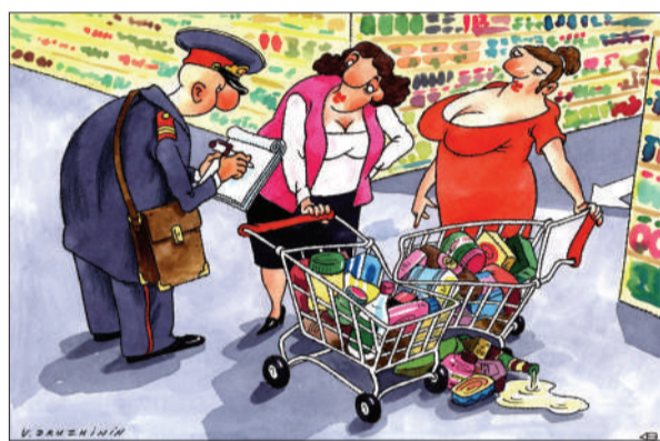
节日里的超市事故 瓦伦丁(俄罗斯)