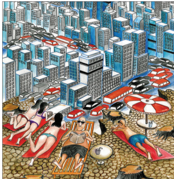
如此过节 韦多(印度尼西亚)