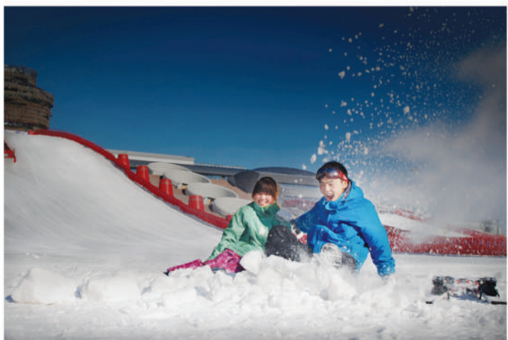
夜幕降临夜滑者在雪场狂欢

得宽绰有余,夜场滑雪者可以放开手脚磨练技艺或展示英姿,可以更自由更轻松去纵情玩耍。