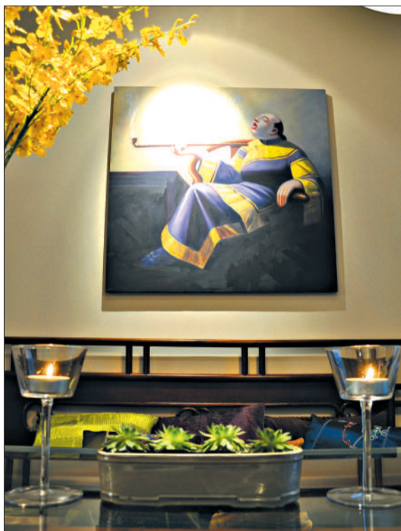
古典元素与现代风格的结合成为今年的流行特色之一。

2012年人们将更愿意使用天然材料的家居产品。越来越多的天然材质被纳入卫浴空间的设计中，木材、石材、藤材等纷纷突破了不适宜制作卫浴用品的定律。另外，纯实木、不刷油漆、不加任何修饰的原生态地板，也将成为一种流行新品。