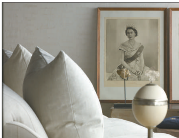
今年流行的个性简约风中增加了鲜明的符号和特色。

2012年主流家装色彩将以黄色、白色为主。一方面，追求个性的人用鲜艳的色彩来放大自身生活的色彩浓度，采用黄色等大胆醒目色彩装饰家居，展现个性；另一方面，强调关注内在精神世界的人们更偏重使用白色、蓝色、绿色等色彩，以寻求简约生活和内心的平静感。