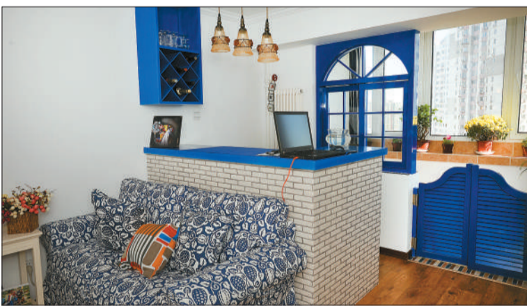
蓝色能给人轻松的感觉。