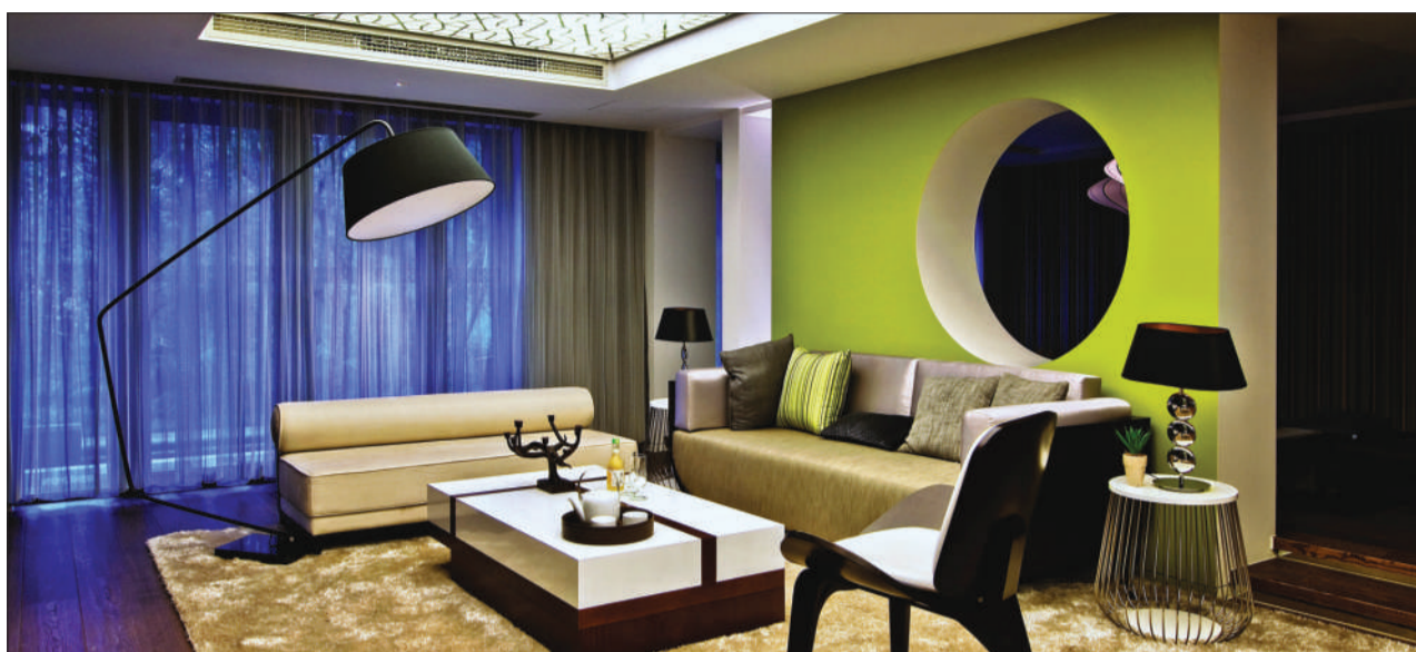
黄色与冷色的搭配更能收获意想不到的效果。