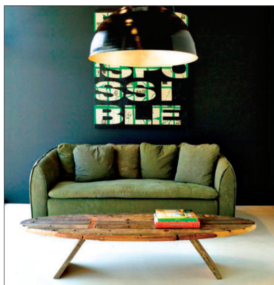
绿色常常在细节上体现优雅。