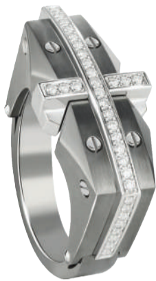
TSL|谢瑞麟型锐男士系列戒指