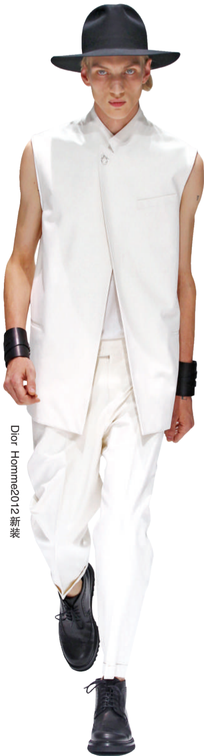
Dior Homme 2012 新装