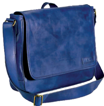
Cole Haan 的信使包