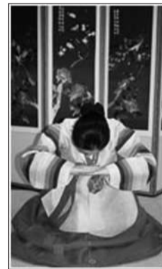
叉开脚坐下上身倾斜45°