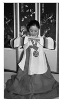
先跪左膝后跪右膝