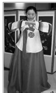
拱手，与肩保持一边齐