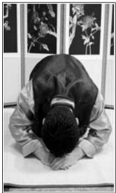
手背贴着额头行礼