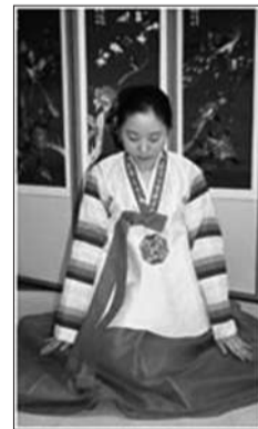
手贴着地面起上身