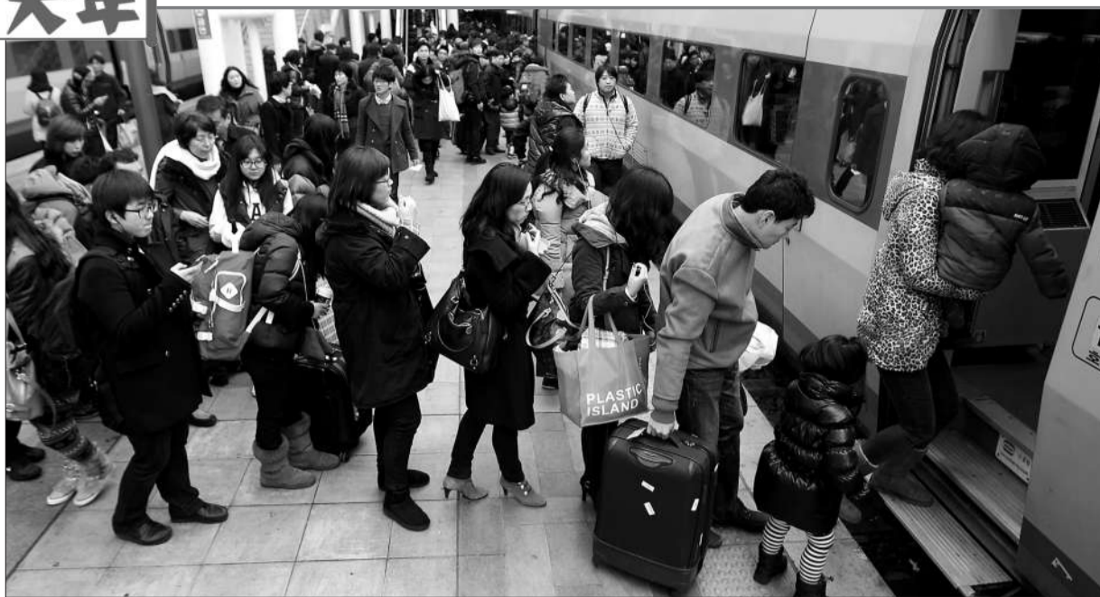
当地时间今年1月20日，韩国首尔，民众搭乘火车返乡过春节。