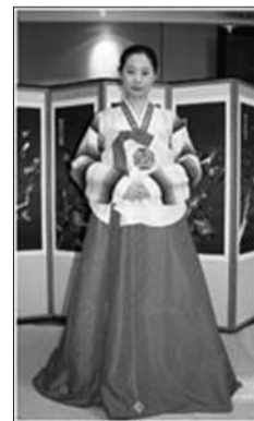
左右脚整齐站一起，拱手回原位