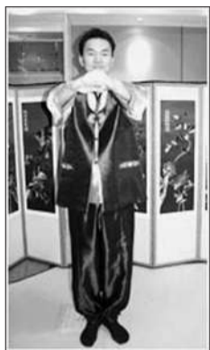
拱手面对行礼对象