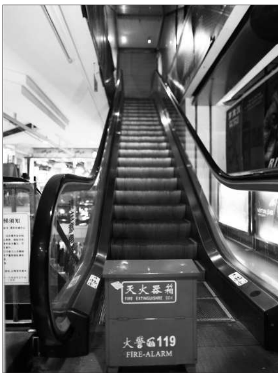
昨日下午,西单新一代商场,事发扶梯已停止运行。