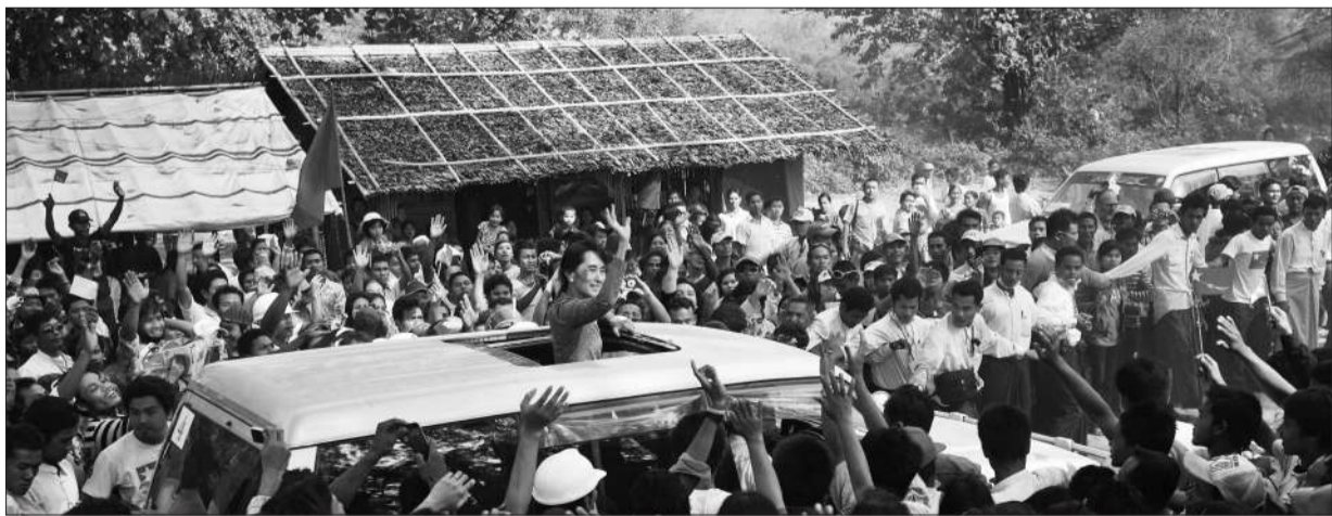
29日，缅甸土瓦，数以千计民众在乡村土路上列队欢迎昂山素季的到来。

今年4月的补选，共有48个议席空缺，如果昂山素季成功当选，将会是她首次进入议会。分析认为，即便昂山素季胜出也权力有限，但意义重大，因为这意味着缅甸民盟首次有机会在议会发声，因此令外界非常关注，并视其为缅甸改革进步的试金石。（综合）