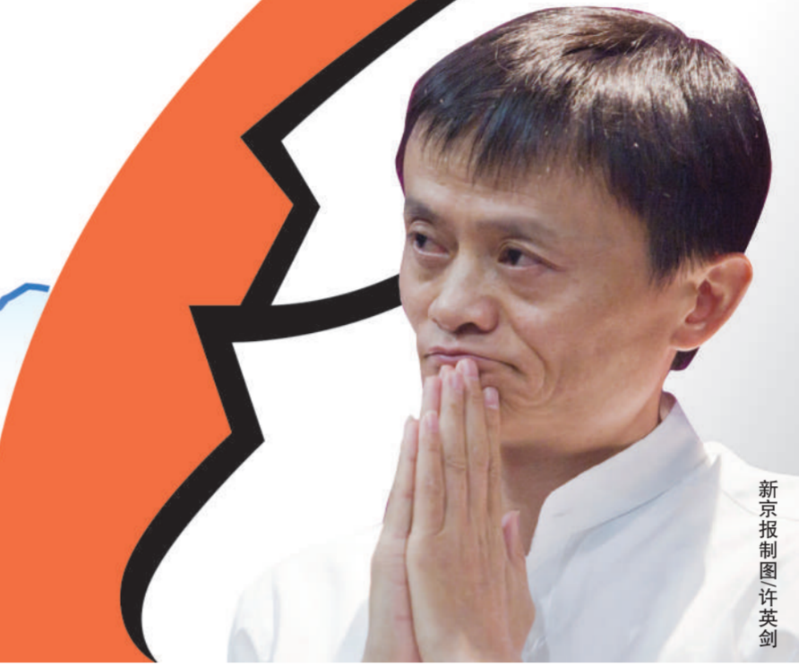
新京报制图 许英剑

中国商务部曾对此表示了严重不满,称“中方认为美方应该全面客观反应中国政府和企业在知识产权保护方面所做的努力和取得的进步”。