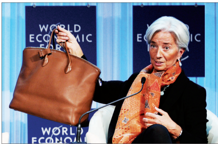
拉加德举着手袋说,来到达沃斯的目的就是筹款。