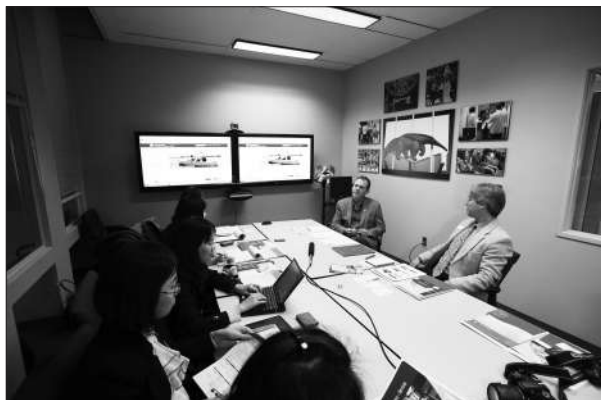
受媒体采访。加州大学欧文分校的校方代表在接

考试和实际生活与学习还是会有一些距离,尤其对于缺乏这方面经验的中国学生而言。我刚到美国时闹过一些笑话。有一次我到处找垃圾桶,问了好几个学生他们都一脸茫然地看着我。后来同学跟我解释了,我才知道,原来在美国“垃圾桶”叫 Trash can,而我们背的雅思词汇里用的都是英联邦国家的说法 Rubbish bin。不过,随着生活和学习的深入都会逐渐克服。