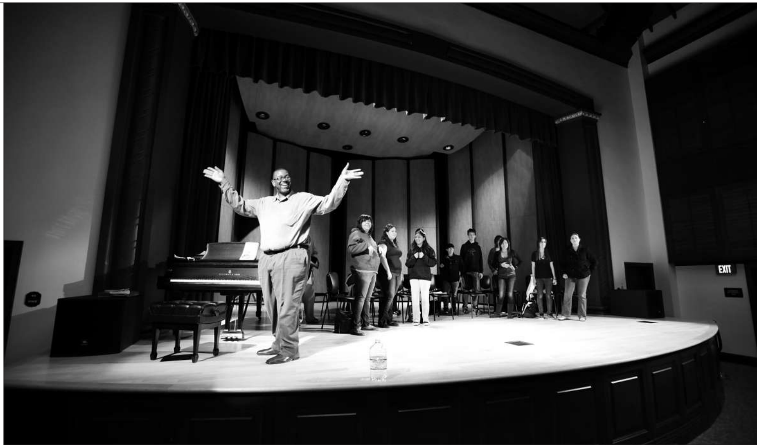
拉文大学的音乐课外活动课现场。