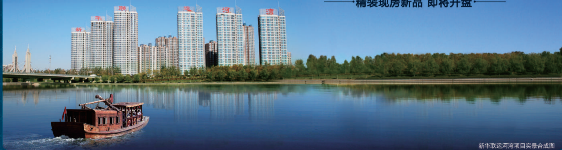
新华联运河湾项目实景图合成图