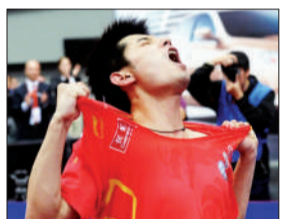
小德(右)夺冠后的庆祝方式，张继科在鹿特丹也上演过。