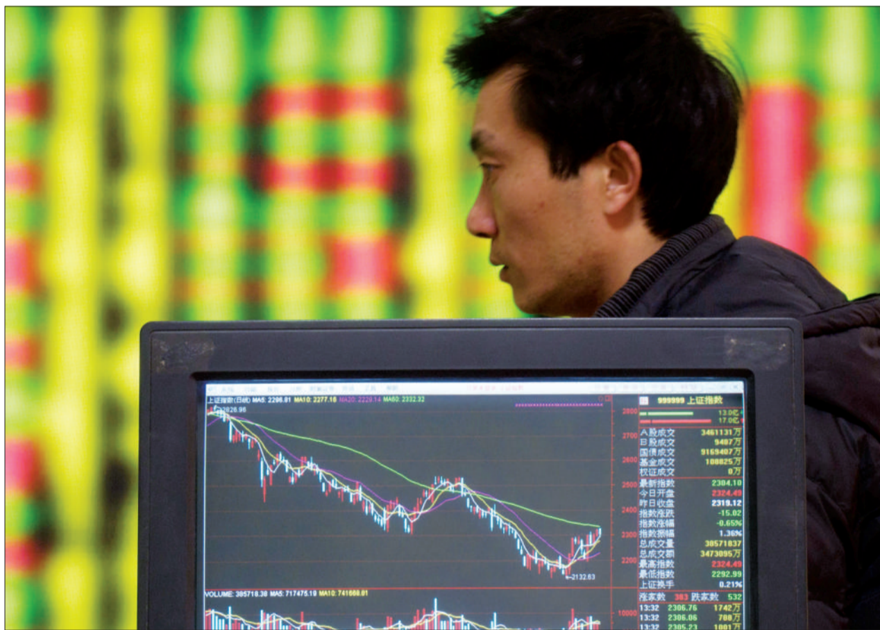
昨日上证综指报 2285.04 点, 下跌 1.47%。

官方微博更正并致歉,发布四条投诉热线,称“高价海鲜事件”调查处理结果将及时公布 B03·关注