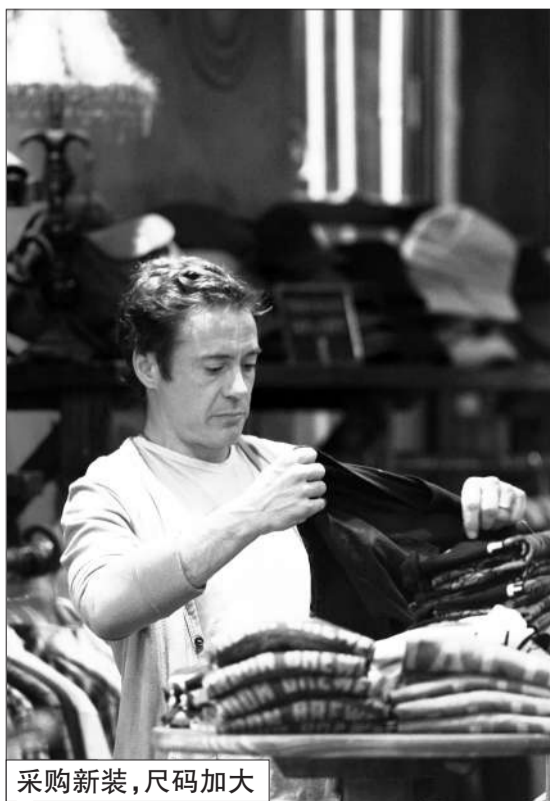
采购新装，尺码加大