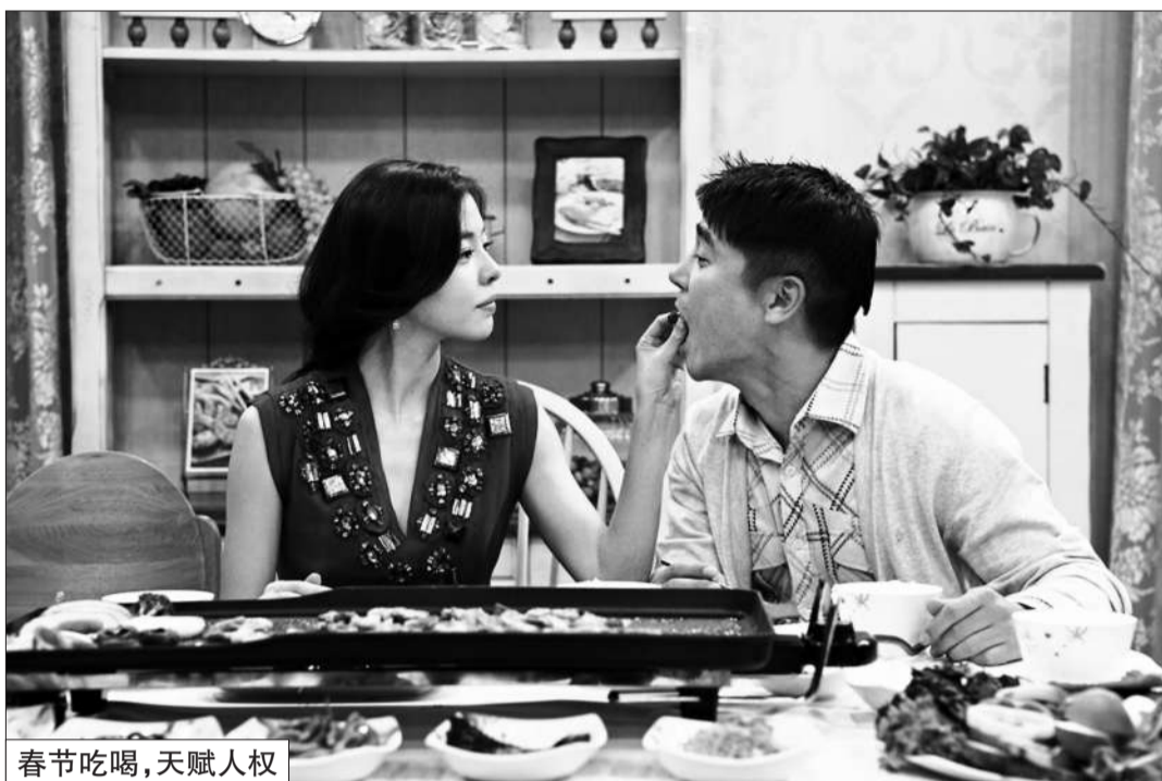
春节吃喝，天赋人权

欢乐祥和、胡吃海塞的春节长假过完，生活已经切换到规律的日常模式。长假刚刚开始时的大鱼大肉，如今让人少了很多食欲。一过磅，好不容易减下去的体重又回来了，这个铁一般的事实也让许多上班族默默地开始了“悔过性节食”。吃否吃否？这是春节过后的一个问题。