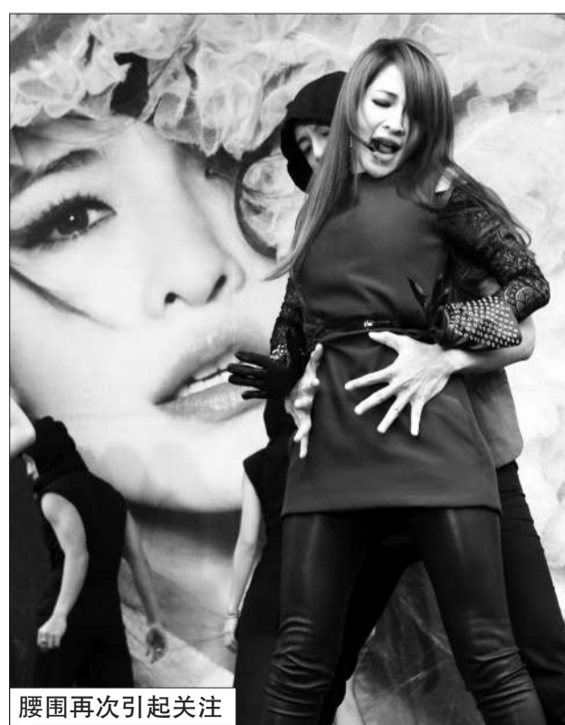
腰围再次引起关注