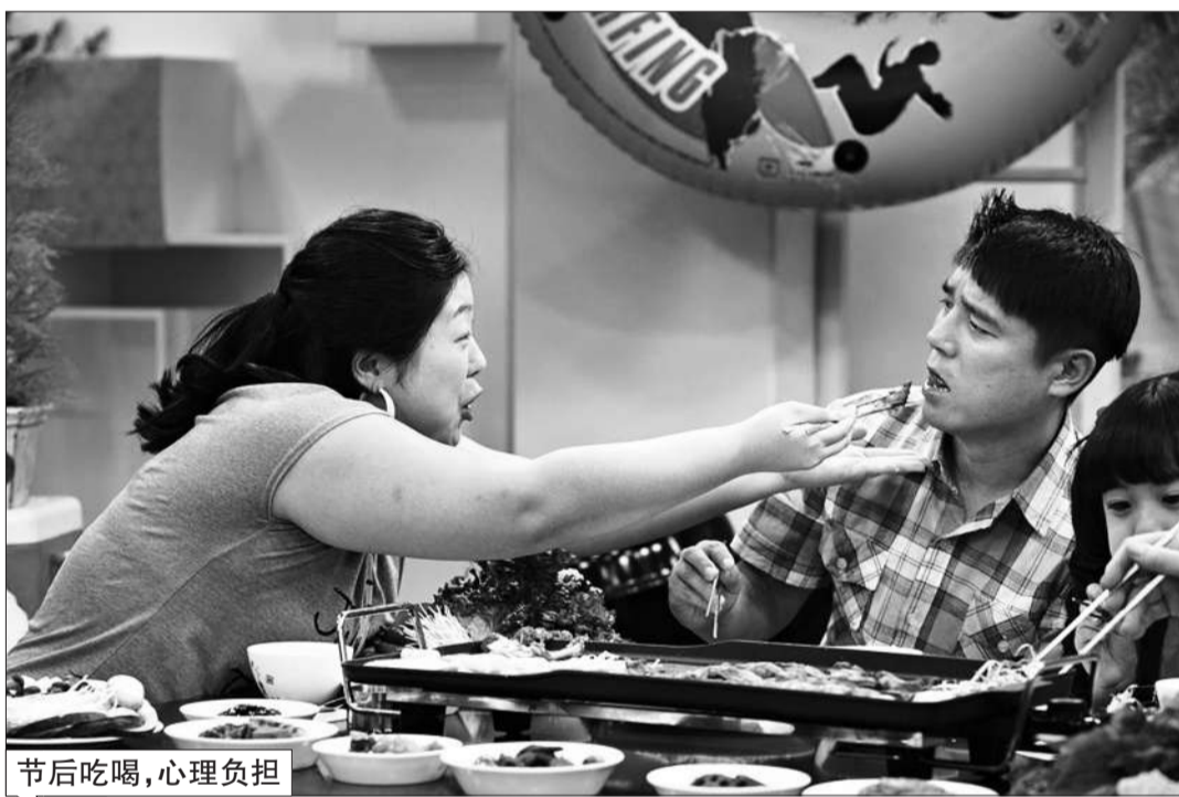
节后吃喝，心理负担