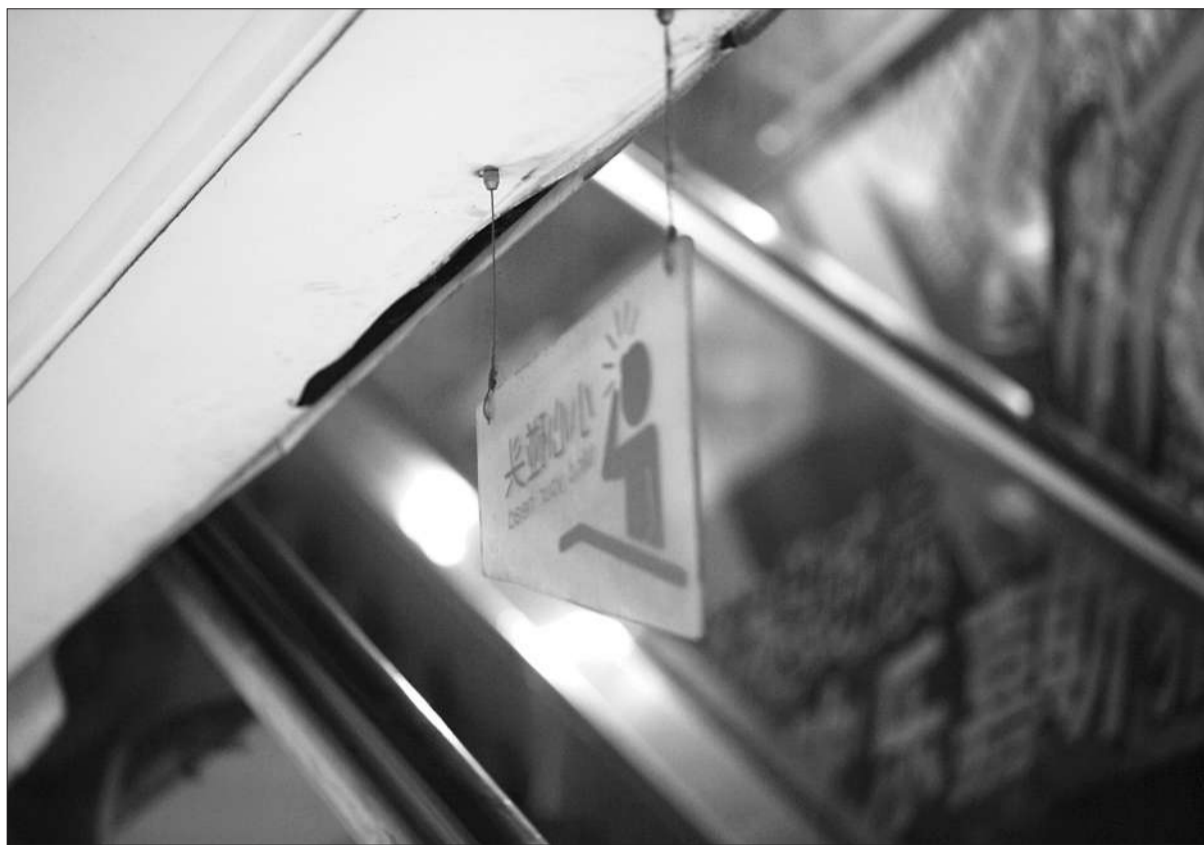
1月29日,新一代商城事故电梯夹角处的“防护板”(板的高度约27厘米,加上悬挂绳超过30厘米)。