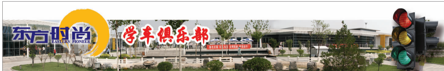
东方时尚驾驶学校掠影之