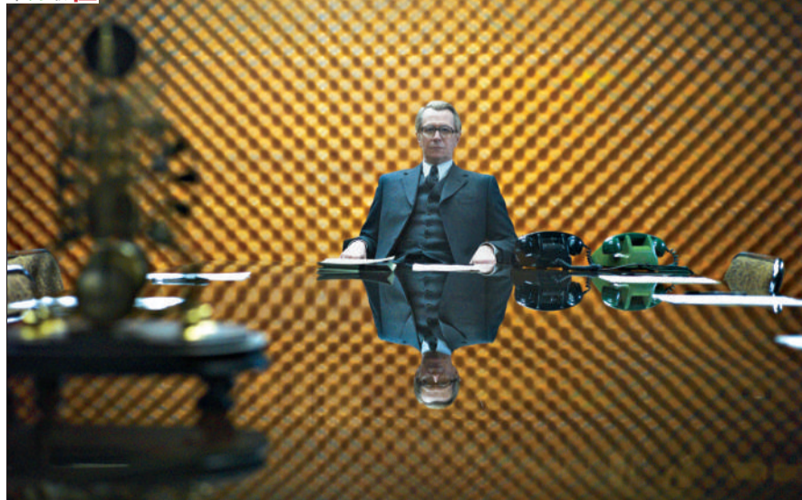
加里·奥德曼饰演的史迈利气场十足,最后顺理成章地当上了“圆场”领导人。