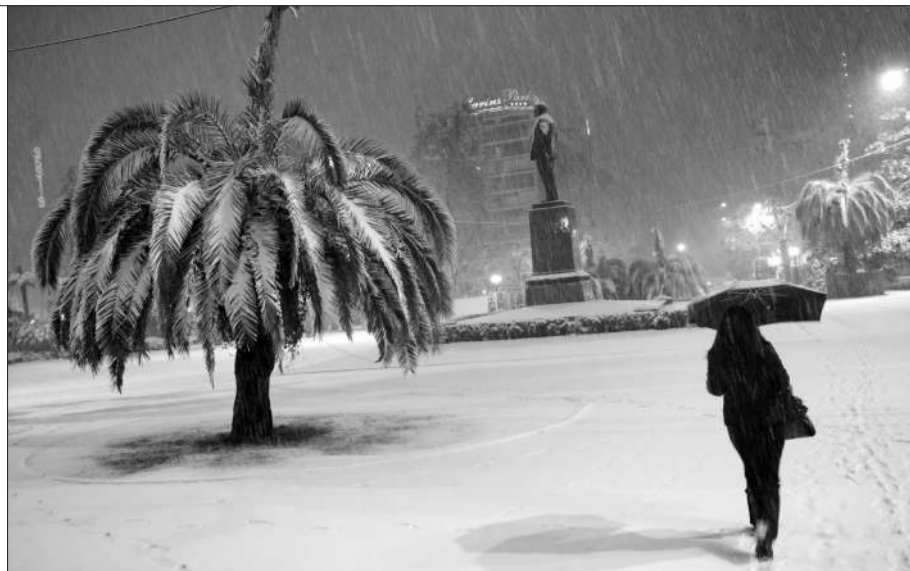
在俄罗斯黑海度假胜地索契，一名妇女在大雪中走在街上。