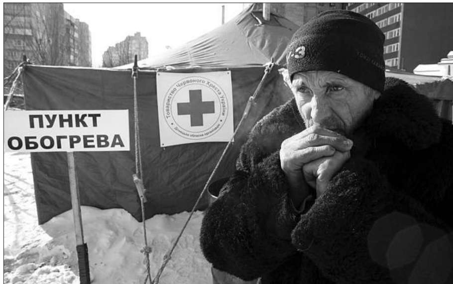
乌克兰顿涅茨克，一名无家可归者在临时收容处。