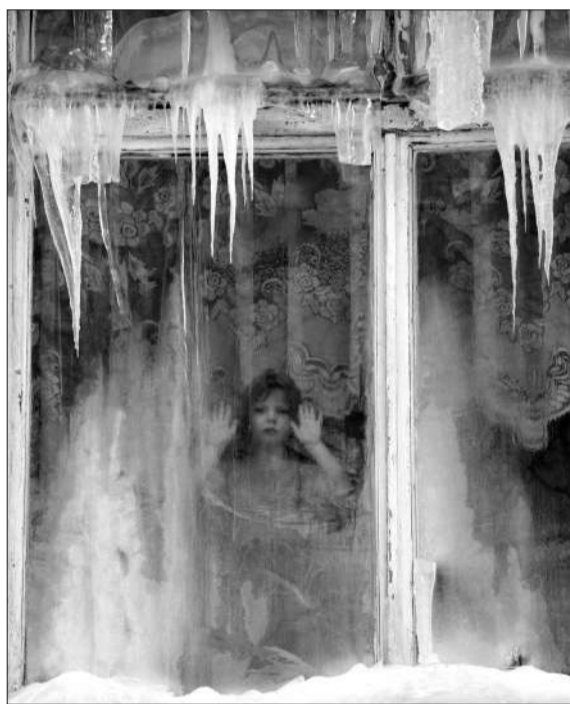
白俄罗斯明斯克，一所幼儿园的窗户上挂满了冰柱。