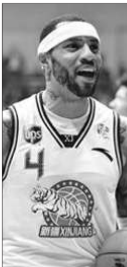
据悉,马丁离开新疆队时,只得到12场比赛的薪水。

昨日,马丁与老鹰的管理层商谈加盟的可能,另外,热火、快船、马刺、尼克斯和湖人都已经加入追逐马丁的行列,快船队甚至已经提供了迷你中产,一份价值250万美元的合同给马丁。