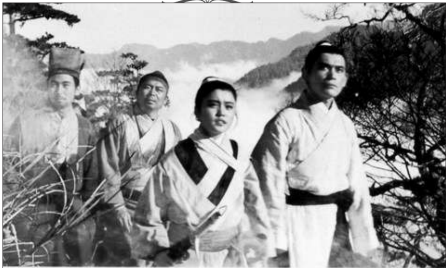
胡金铨拍摄的第一代“龙门”电影——《龙门客栈》。