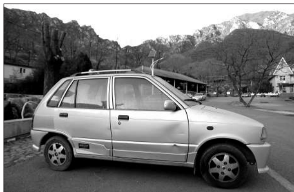
失踪男子停在农家院的轿车。