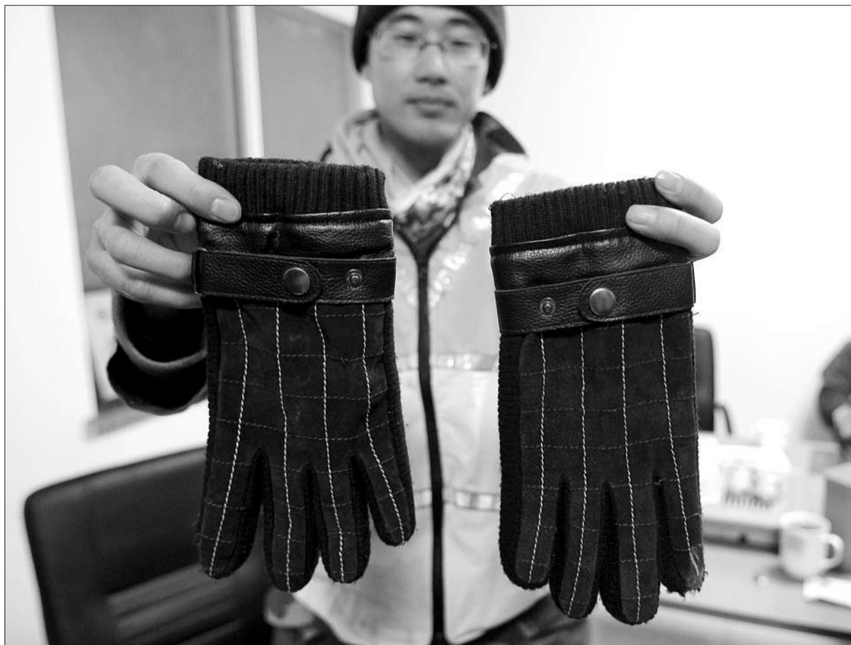
昨日,蓝天救援队人员在山上找到一副手套,经家属确认为失踪者所有。