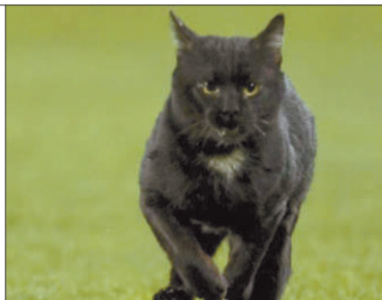
诺坎普的吉祥黑猫。

值得一提的是,尽管有人认为黑猫出现不是吉兆,可是每当它出现在诺坎普,巴萨都取得了胜利。上一次它登台亮相的时候,巴萨5比0完胜维拉利尔。(范遥)