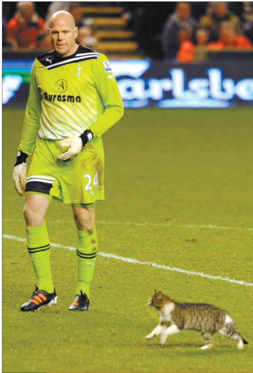
小猫在安菲尔德卖萌,弗里德尔成为背景。