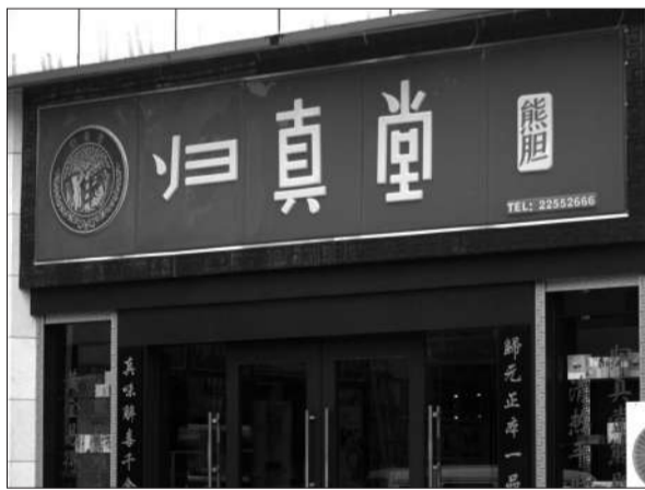
2011年2月11日,福州市区一家归真堂分店。

对此,记者致电中国中药协会,该协会办公室相关负责人对记者说,已了解到舆论反应,但此前并不清楚上述文件已公开。协会已经向相关主管部门进行了请示,并计划在近日召开新闻发布会。这位人士还对记者表示,截至9日晚上还未收到亚洲动物基金的正式交涉。