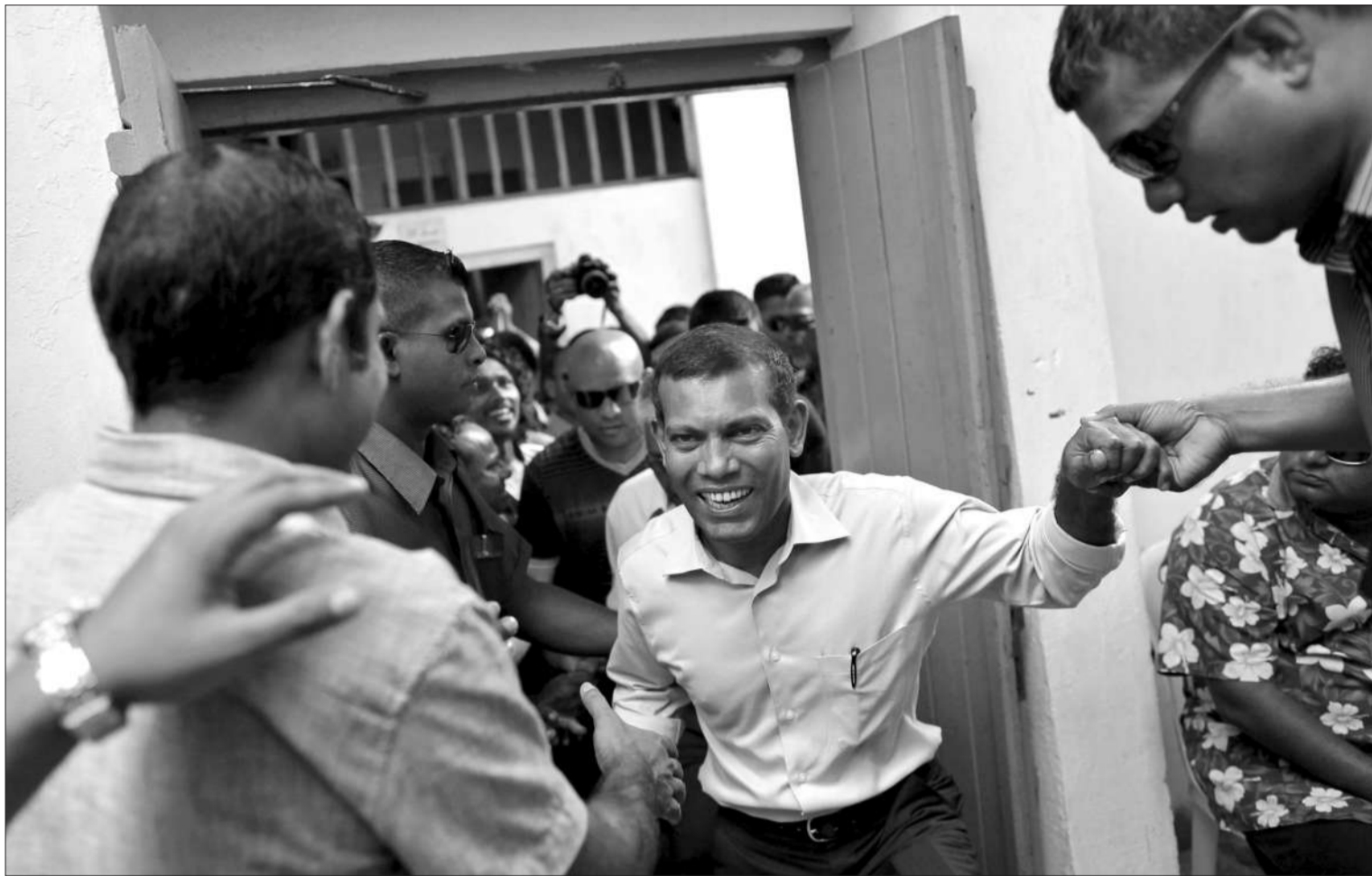
2月11日,在结束同来访的美国助理国务卿的会晤后,马尔代夫前总统纳希德回到位于首都马累的家时受到支持者的欢迎。