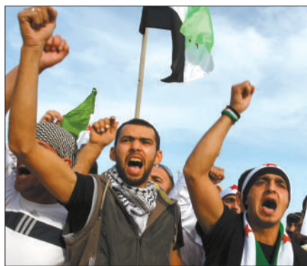
8日，卡塔尔，叙反对派举行集会。

霍姆斯、哈马、德拉……自从去年3月，中东北非的民众示威浪潮蔓延叙利亚以来，这些原本并不知名的城市，开始频繁出现在国际主流媒体的热点报道中。霍姆斯等地，一直是叙利亚反政府力量活动的中心，以及该国持续动荡的“风暴眼”。近一年以来，叙利亚的反政府力量何以能在这些城市持续对抗强大的政府军？这些矢志推翻巴沙尔政权的“杂牌军”，到底有何背景？