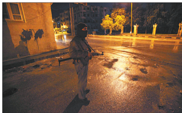
8日，叙利亚伊德利卜，一名反对派成员正在街头守卫。