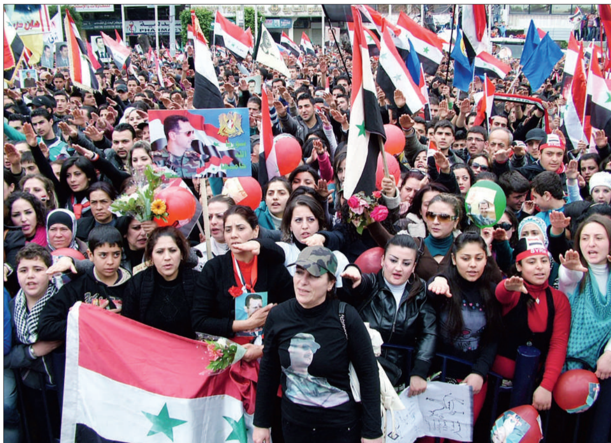
14日,叙利亚海港城市拉塔基亚,总统巴沙尔的支持者挥舞国旗集会示威。

叙利亚政府否认反对派说法,其官方媒体报道称,“武装恐怖组织”是袭击制造者。(综新)