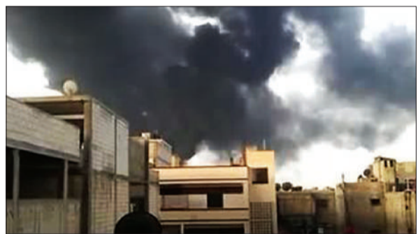
15日,叙利亚霍姆斯,视频截图显示油管爆炸冒出缕缕黑烟。霍姆斯是当前叙利亚冲突最为严重的地区之一,这一地区的炼油设施和输油管道多次遭到破坏。