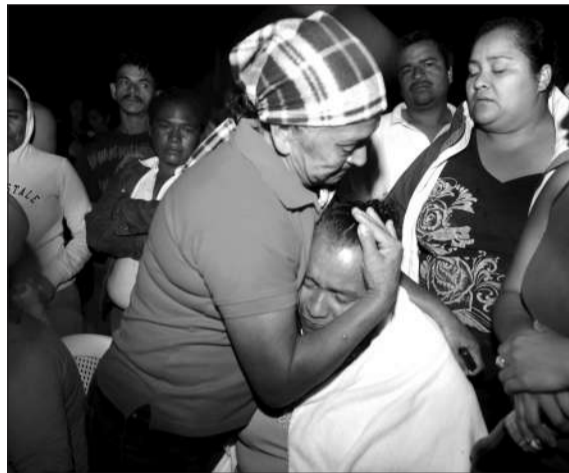
15日，洪都拉斯，事发监狱囚犯的亲属在监狱门口痛哭。