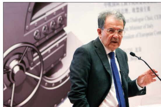
昨日,欧盟前主席普罗迪在演讲。本报记者 浦峰 摄

华夏典当行方面还表示,如果国家持续严格的调控政策,市场成交量持续低迷,那么低评估价、低折当率的政策会继续。